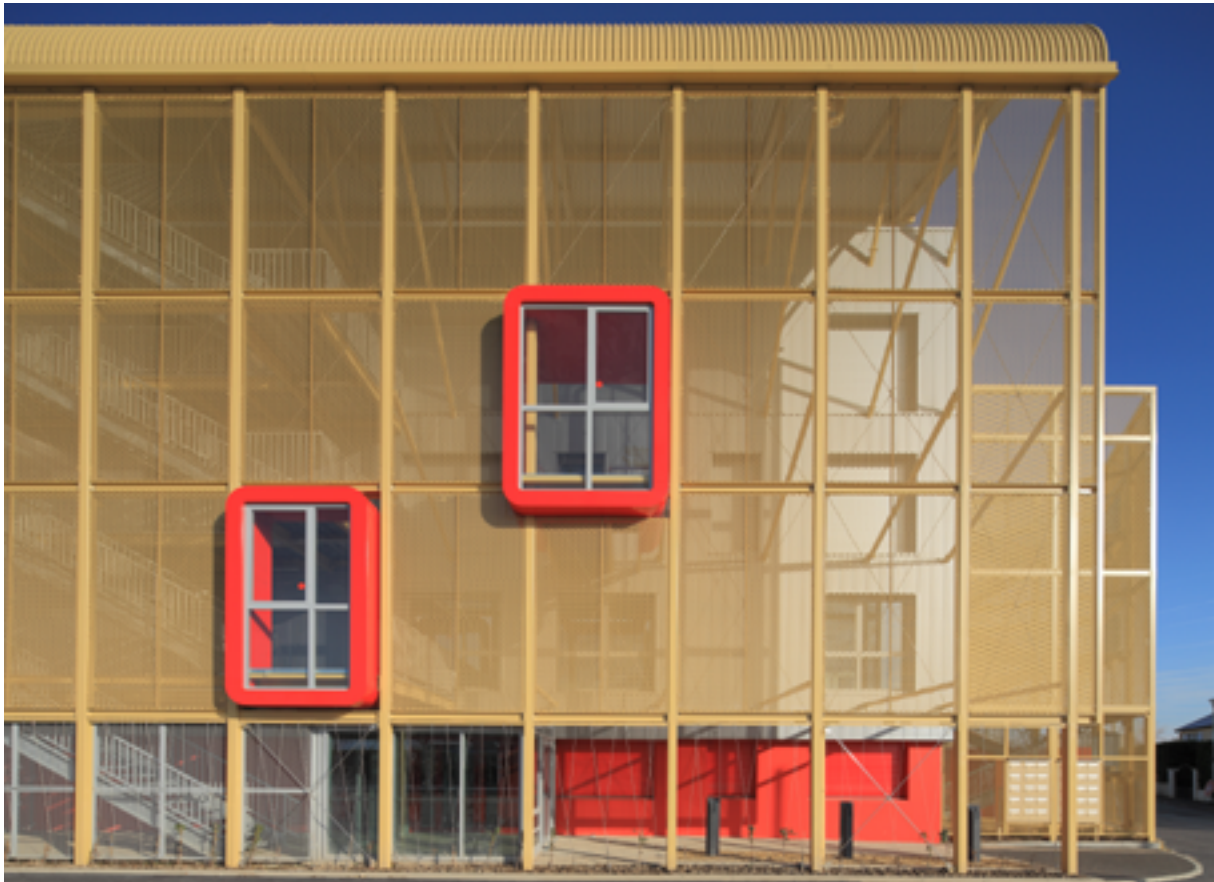
En façade, des "boîtes à penser" invitent les jeunes entrepreneurs à la réflexion et les projettent dans le paysage.

Le tramway de l'agglomération tourangelle inauguré fin août 2013 dessert évidemment la pépinière de Joué-lès-Tours, baptisée (S)tart'ère, au cœur de La Rabière. Tout un symbole. L'un comme l'autre ont vocation à changer l'image du quartier, situé en zone de redynamisation urbaine. Le projet a d'ailleurs reçu une importante subvention - 650 000 € - de l'Agence nationale de rénovation urbaine.