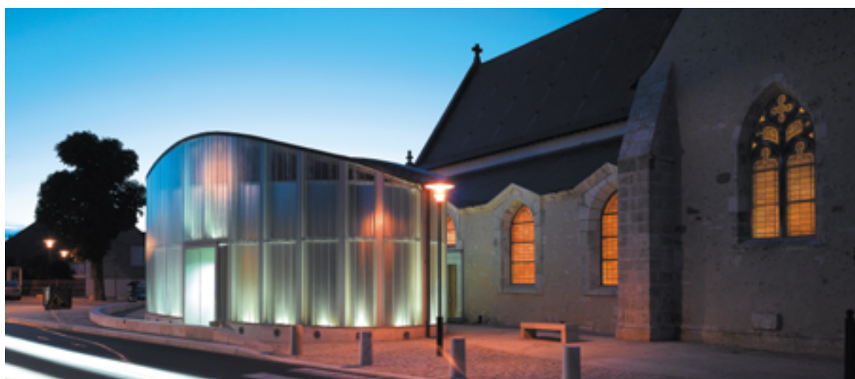
L'église Saint-Germain de Sully-sur-Loire (Loiret) transformée en salle de concerts et d'expositions.

Notre agence s'est construite au fil de vingt-cinq années de carrière professionnelle en privilégiant la cohérence dans la forme, dans la démarche et dans le discours.